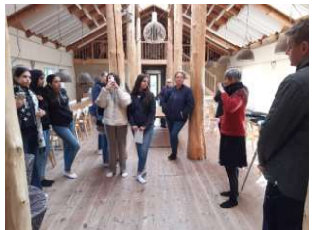
Billedet er fra Munksøgaard

Arbejdsgruppen for Miljø og genbrug tog til Munksøgaard og Musicon – begge i Roskilde: