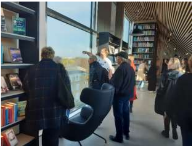
Billedet er fra Tingbjerg Bibliotek

Arbejdsgruppen for Center og fællesfaciliteter tog til Tingbjerg bibliotek og Prismen og Kvarterhuset på Amager.