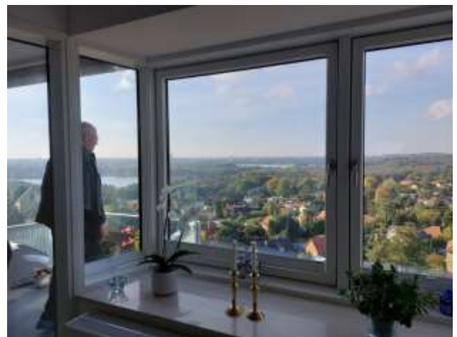
Billedet er udsigten fra en renoveret lejlighed i Sorgenfrivang II.

Arbejdsgruppen for Boliger tog til Sorgenfrivang II i Kgs. Lyngby og Ellebo i Ballerup: