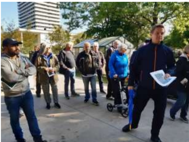
Billedet er fra Remiseparken.

Arbejdsgruppen for Udearealer og parkering tog til Remiseparken på Amager og til Farum Midtpunkt.